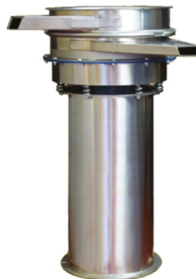
- Crible avec bâti surélevé