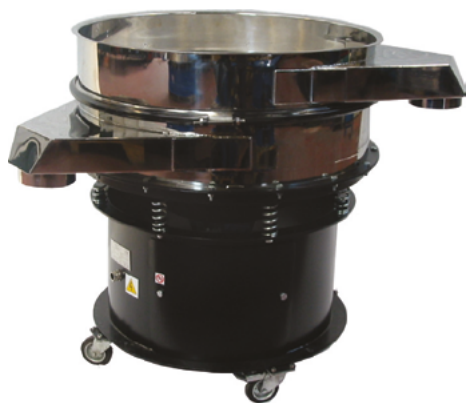
- Finition poli-miroir