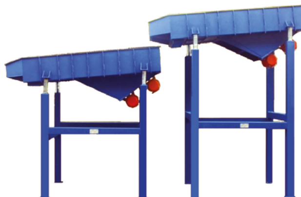
- Cribles rectangulaires en série