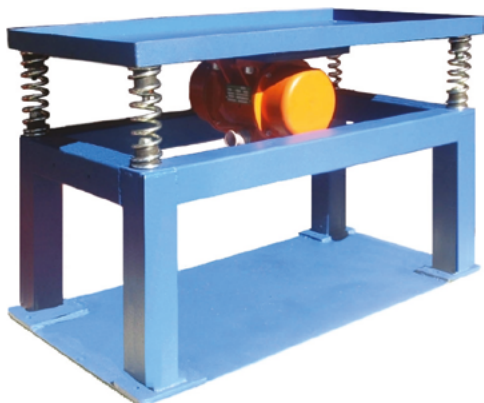
- Table de compactage

Grâce à une grande flexibilité de production, nous sommes en mesure de réaliser des exécutions spéciales pour répondre aux besoins de nos clients. Sur les photos, quelques exemples des productions effectuées.